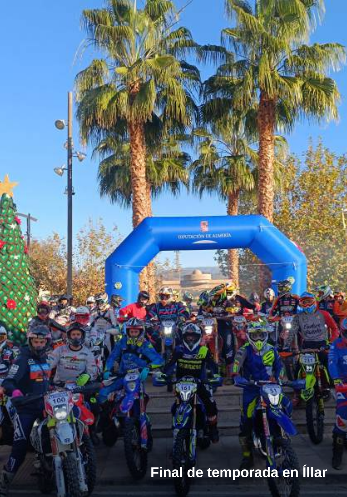
Final de temporada en Íllar