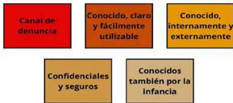
Figura 1. Respuesta y gestión de casos de violencia en la entidad deportiva

Todas las entidades deportivas, y por ende todos los agentes que las componen, vistos en la necesidad de denunciar algún caso, deben conocer el canal de denuncia, el cual debe ser claro y fácilmente utilizable (Figura 1). Se da más detalle en el ANEXO 09 “Canal de denuncia” para realizar la comunicación de situaciones de violencia en la entidad deportiva.