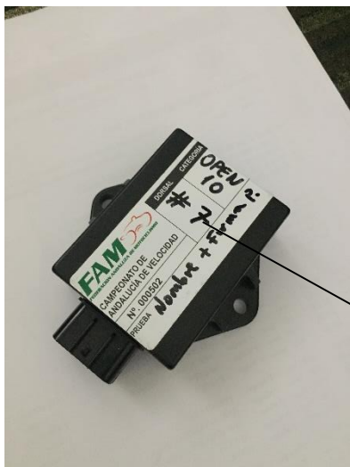
(1*) PRECINTADO CENTRALITA