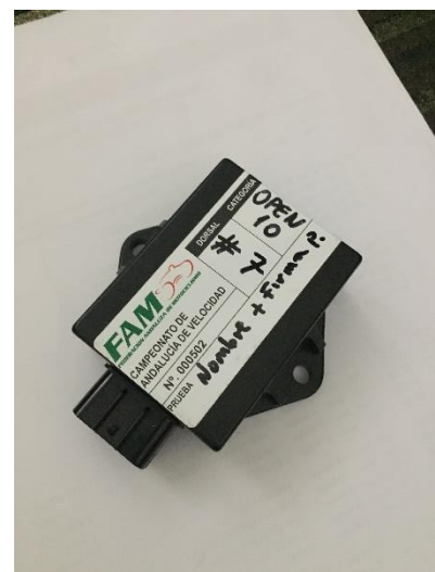
(1*) PRECINTADO CENTRALITA